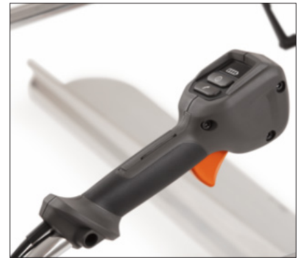
Handgriff mit stufenlos verstellbarer Drehzahl.