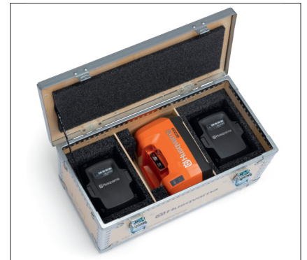
Praktische Transportbox für das Ladegerät und die beiden mitgelieferten Akkus.