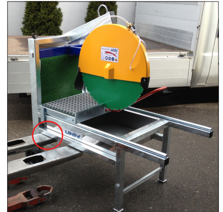
Sicherheitslaschen für den Staplertransport (quer und längs)